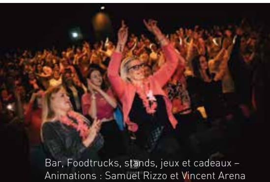
Bar, Foodtrucks, stands, jeux et cadeaux – Animations : Samuel Rizzo et Vincent Arena

Les « Ladies » débarquent en ciné plein air, les 12 et 13 juillet