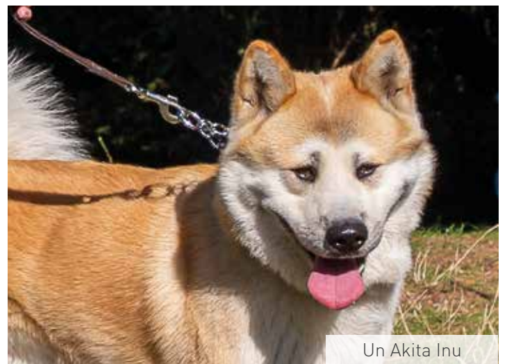
Un Akita Inu

Pour tous renseignements : 04 247 72 23.