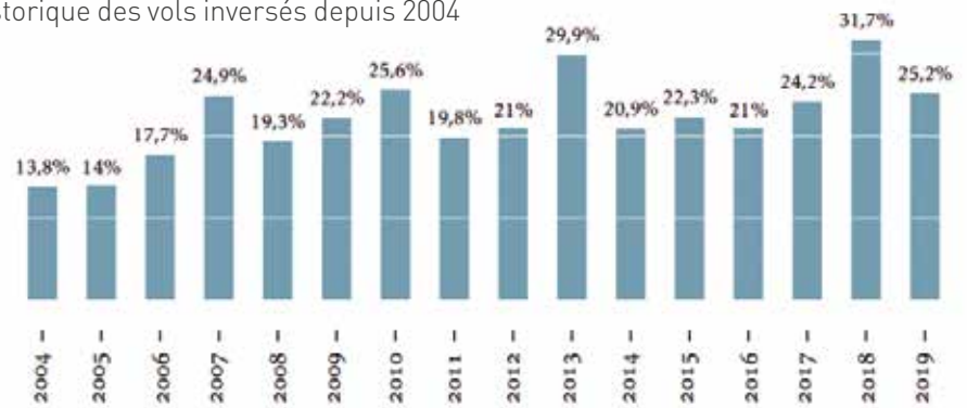
Historique des vols inversés depuis 2004

Dans ce contexte, la commune d'Ans reste et restera particulièrement attentive à l'évolution de la situation afin de garantir à sa population un confort et des conditions de vie dignes de ce nom.