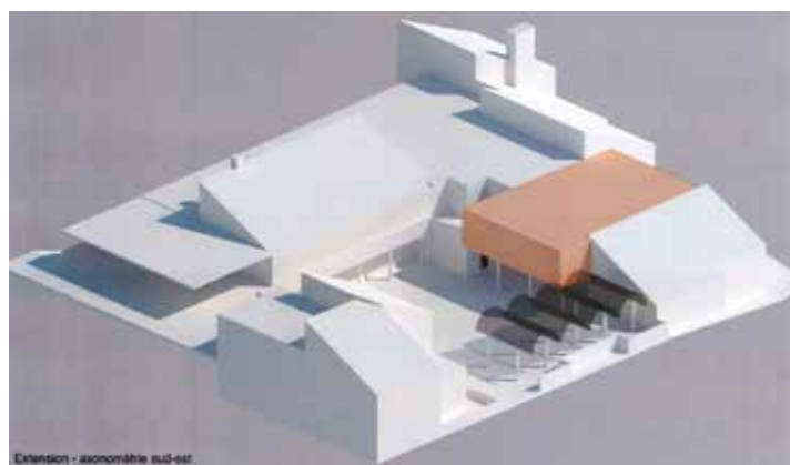
Extension - axonomie sud-est