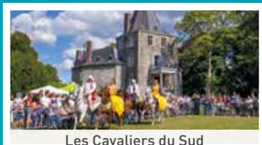
Les Cavaliers du Sud