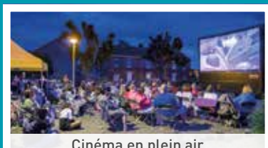
Cinéma en plein air

Focus sur quelques évènements de l'été organisés par l'Echevinat de la Culture, du Tourisme et du Patrimoine : Merci pour votre participation !