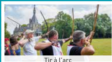
Tir à l'arc