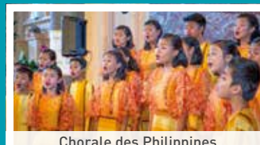
Chorale des Philippines