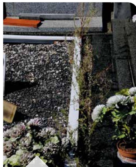
Trouver des solutions pour les espaces entre les tombes