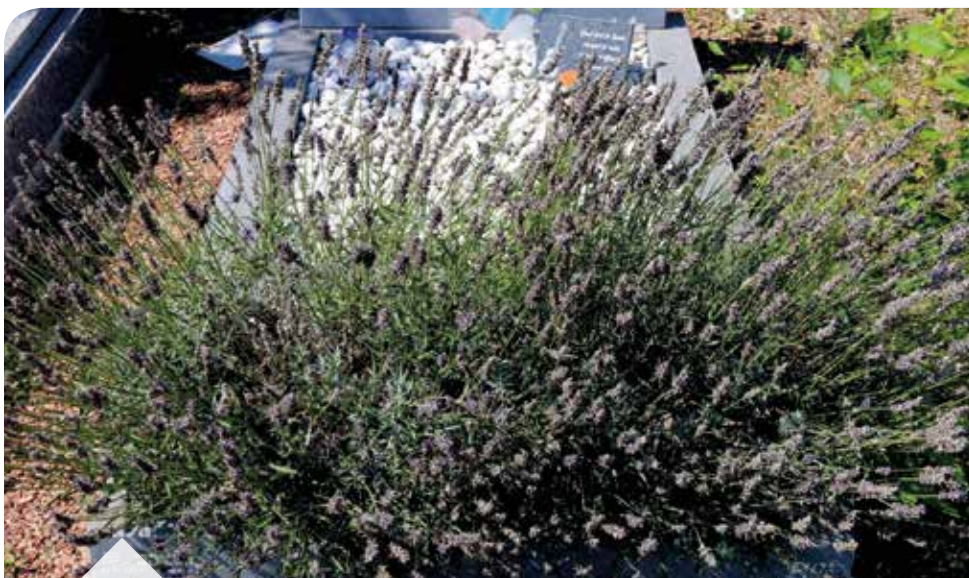
Un choix d'aménagement persistant et facile d'entretien