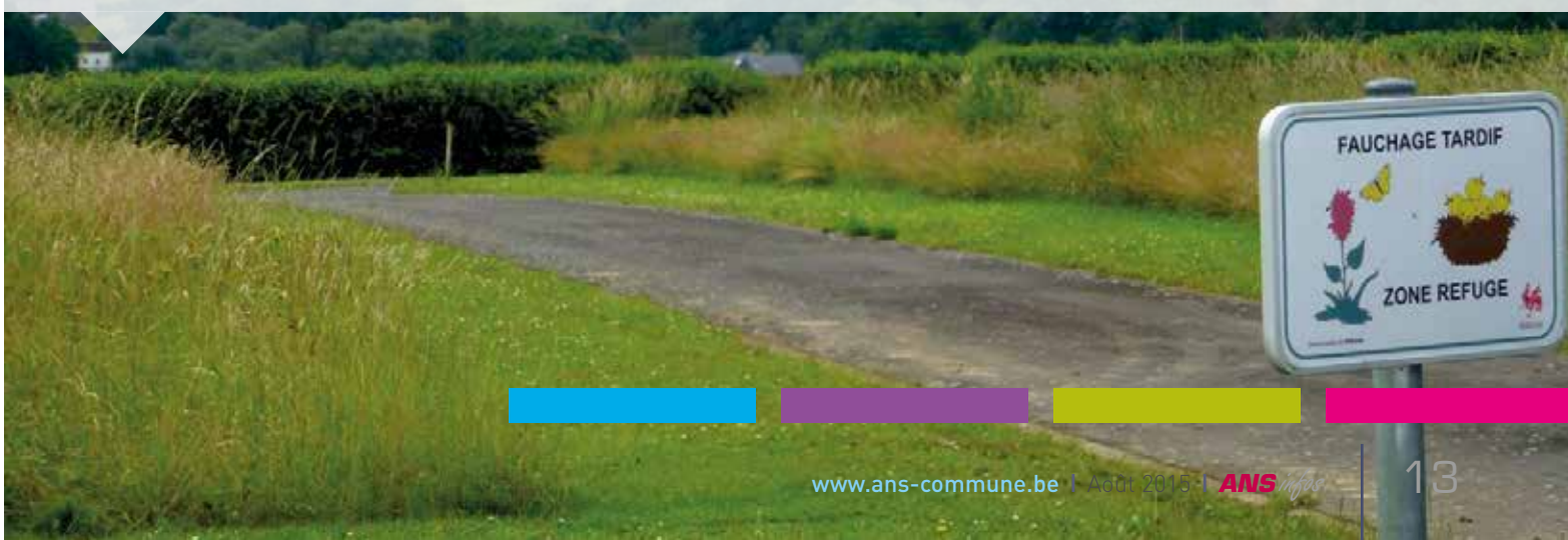
Partie de cimetière géré de façon différenciée