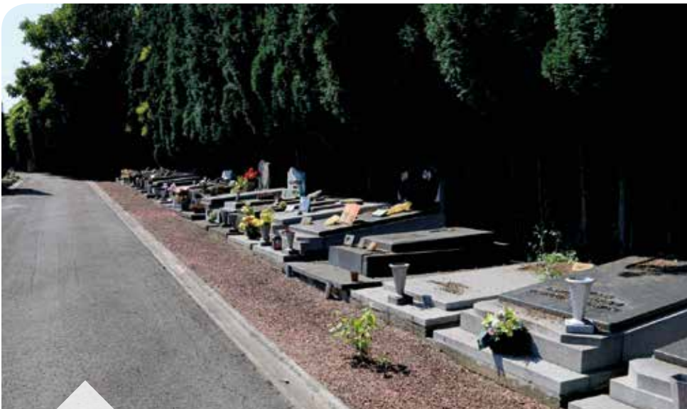
Une jeune pousse qui a été « oubliée » dans les graviers : on ne voit qu'elle