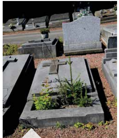
Un choix d'aménagement qui risque de poser bien des problèmes quand les conifères auront pris de l'ampleur