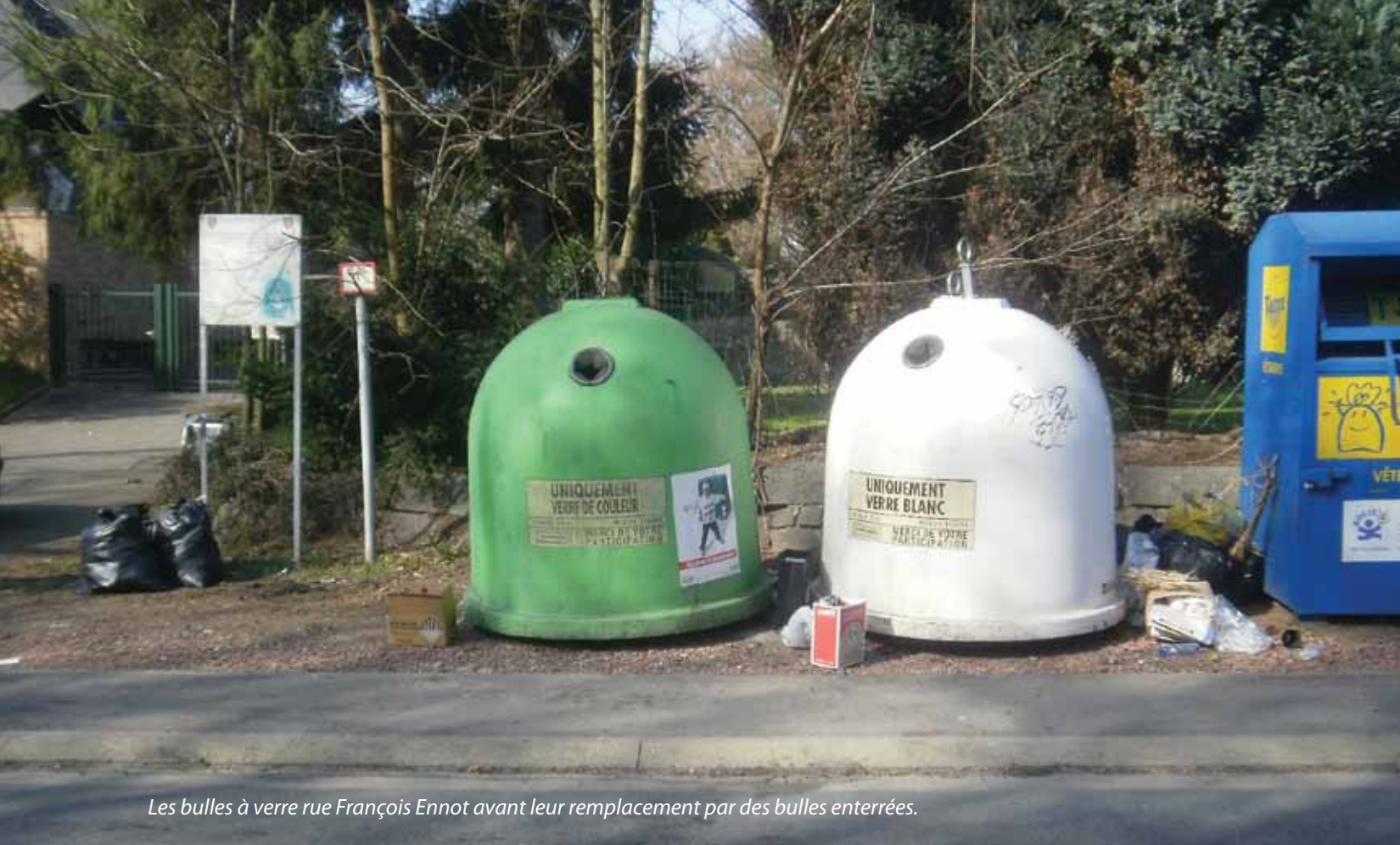
Les bulles à verre rue François Ennot avant leur remplacement par des bulles enterrées.