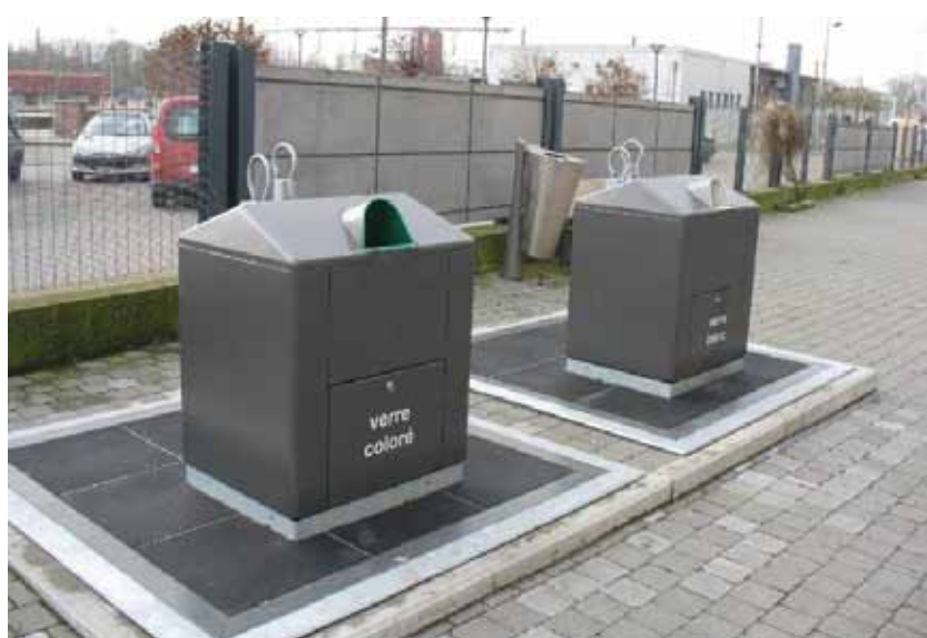
Bulles enterrées rue Maréchal Foch

Ce ne sont pas moins de 14 sites de bulles à verre qui jalonnent notre commune, ce qui a permis à Intradel de récolter sélectivement 33,4 tonnes de verre blanc et 33,38 tonnes de verre coloré en 2011. Malheureusement certains citoyens sans scrupules n'hésitent pas à garnir le pied des bulles de déchets en tous genres. La plupart du temps ces déchets faisant partie de collectes sélectives ou pouvant être déposés gratuitement dans les recyparc: papiers, cartons, vêtements, sacs de déchets divers... ces gestes sont incompréhensibles. Malgré un nettoyage quotidien fastidieux et onéreux, rien ne semblait y faire.