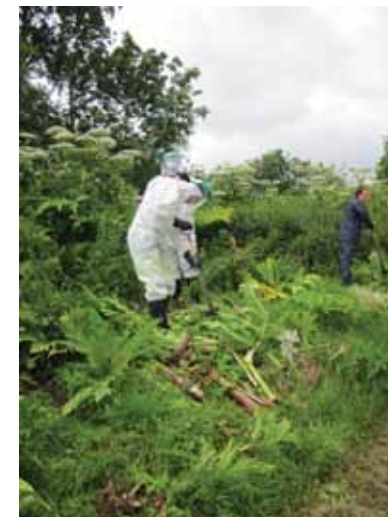
Gestion de la Berce du Caucase rue d'Oupeye

Suite à la présence de berce du Caucase dans la campagne de Xhendremael, le service de l'Environnement a introduit une demande de subsides à la Wallonie afin d'obtenir du matériel de gestion contre cette plante invasive qui avait été localisée en différents endroits de la commune mais malheureusement, principalement dans notre campagne. Vu la présence d'un spot important de ces plantes