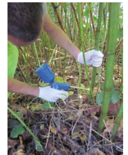
Le pistolet injecteur complet

De quoi limiter, peut-être, l'expansion galopante de la renouée sur notre commune.