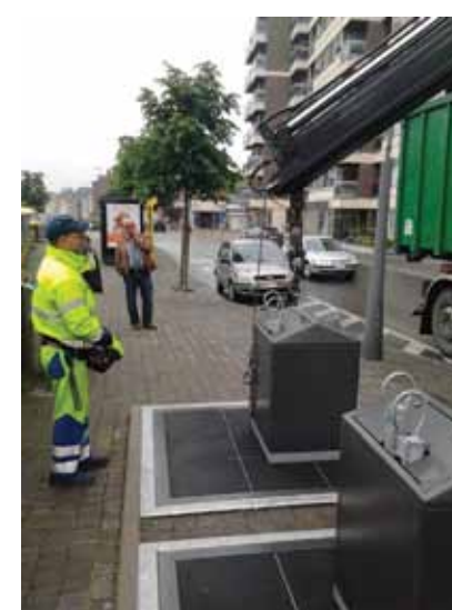
ancrage, extraction, vidange

Le choix de l'emplacement pour ce type de cuves enterrées n'est pas si facile et est lié à de nombreuses contraintes : il faut tenir compte de la masse des cuves en béton et/ou en galvanisé à placer à +/- 2m de profondeur. L'engin nécessaire pour déposer les cuves doit pouvoir se positionner le plus près possible des sites. Mais aussi être attentif à l'espace de manœuvre