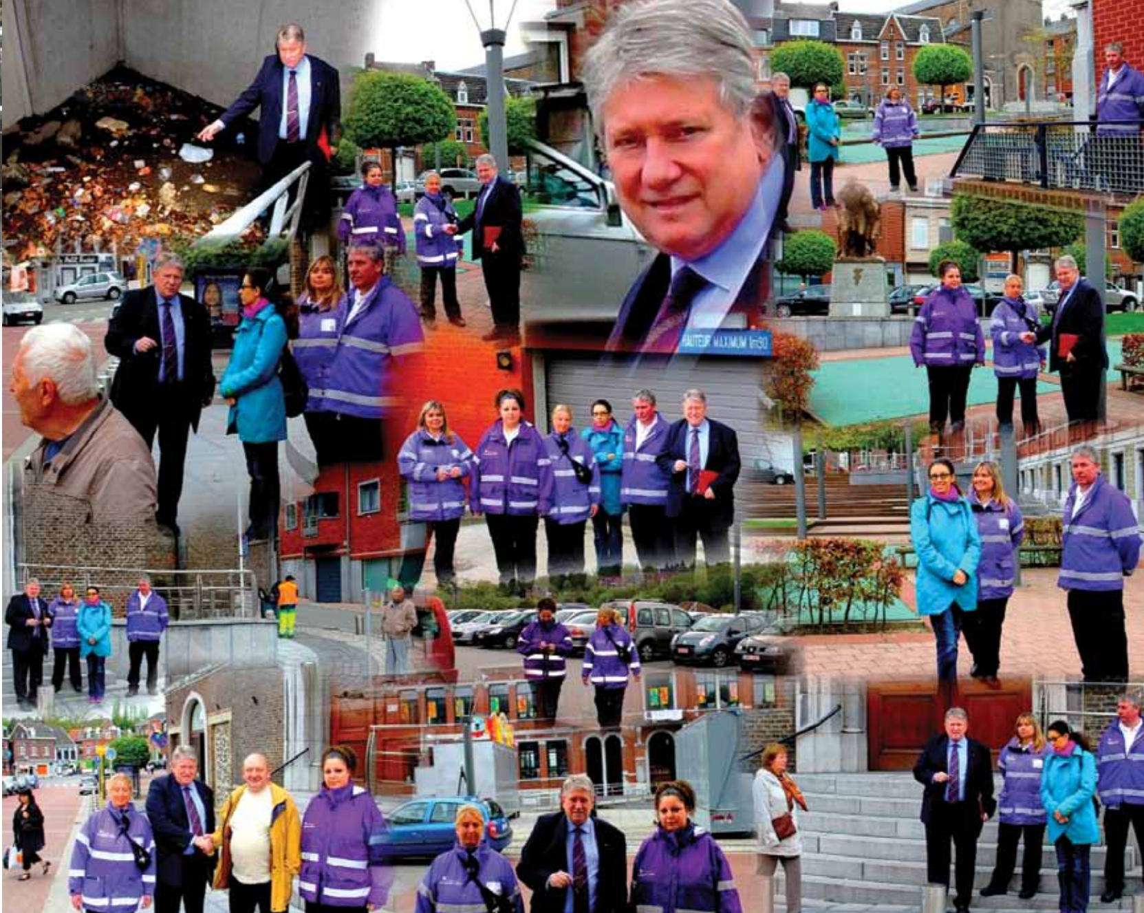
L'Echevin Henri Huygen en inspection avec des Agents de Prévention place Nicolai à Ans.

réguliers avec la police locale en transmettant simplement les constats réalisés en matière de troubles éventuels à la sécurité ou à l'ordre public. Cette mission première doit permettre une intervention mieux ciblée des services de police.