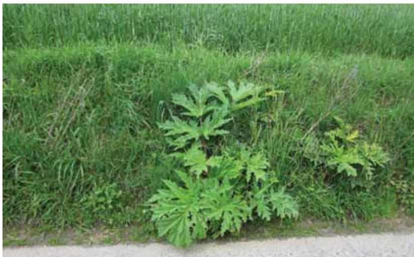
Berce en bordure de champ.

Pour des renseignements et de la documentation sur les plantes invasives ainsi que des conseils de gestion, contactez le service environnement de la commune d'Ans au 04/2477267 ou par mail via environnement@ans-commune.be . Les zones où de la Berce a été observées vont être référencées sur le site de la Wallonie prochainement. N'hésitez pas à nous faire part de vos observations de potentielles nouvelles zones de développement de la berce, qu'elles se situent en terrain public ou privé.