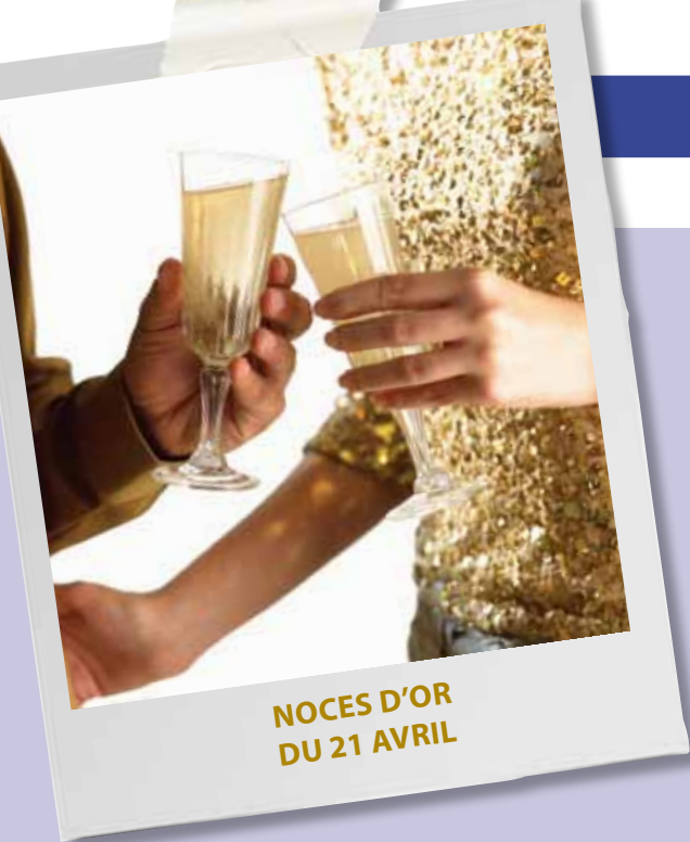
NOCES D'OR DU 21 AVRIL