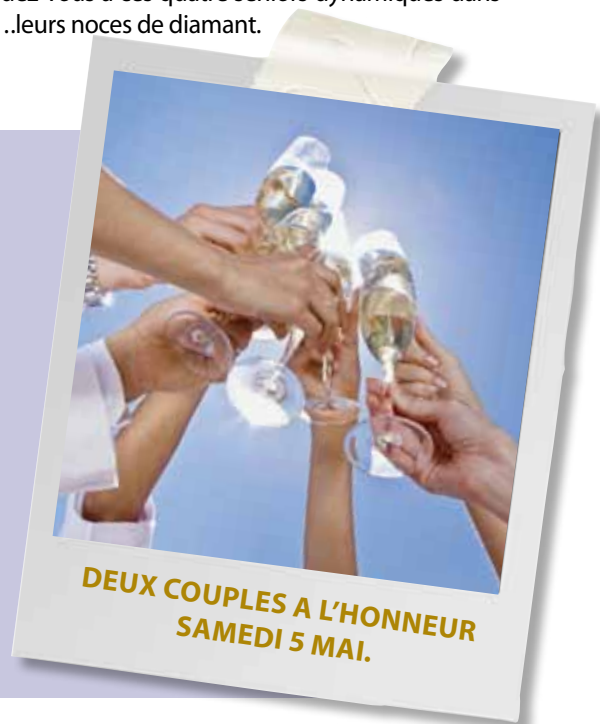
DEUX COUPLES A L'HONNEUR SAMEDI 5 MAI.

• Les époux BUNGENEERS-COLLETTE et DRIESQUE-GEROME étaient invités à la salle des mariages à l'occasion leurs noces d'or. Stéphane Moreau, le Bourgmestre d'Ans profita de l'occasion pour faire un rapide récapitulatif de leurs vies respectives.